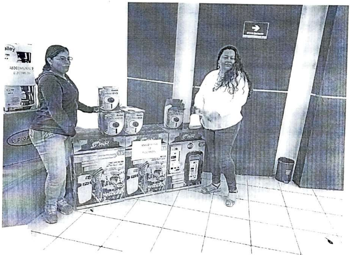
Entrega presupuesto participativo Asocomunal 10