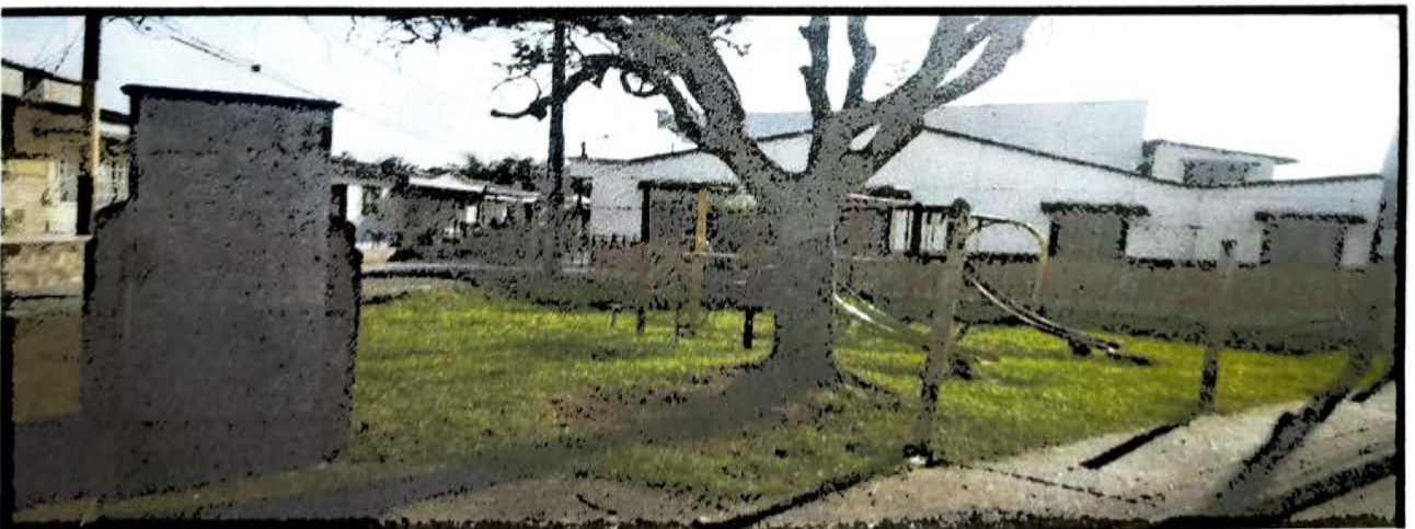
LA ADIELA 2 31 MTS PARQUE INFANTIL