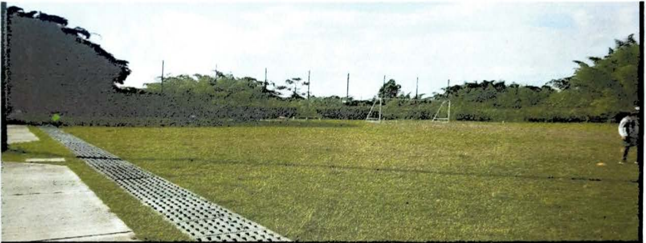
CANCHA DEL PLACER 100 MTS