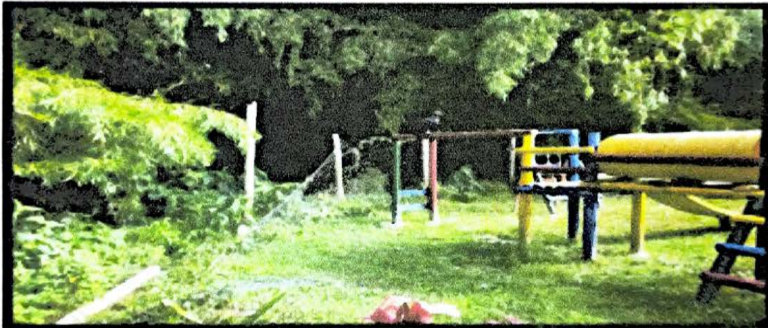
LA RIVERA 40 MTS CERRAMIENTO PARQUE INFANTIL