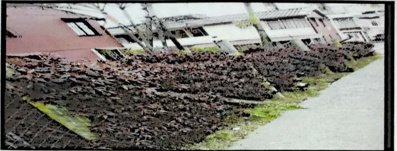
VILLA ANGELA 16 MTS CERRAMIENTO REMANANTE HUERTA COMUNITARIA