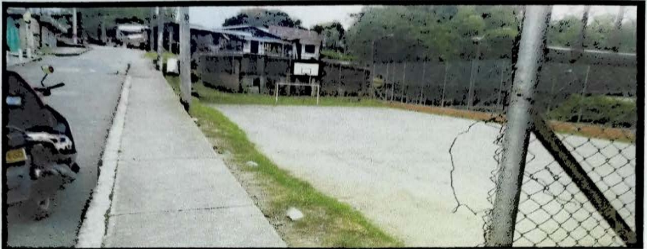
25 DE MAYO 35 MTS CERRAMIENTO CANCHA DE FUTBOLL