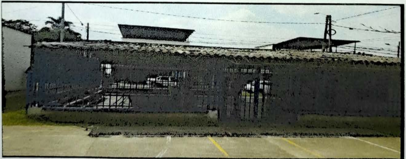
GRECIA 15 MTS LINEALES X 4 DE ALTURA CASETA COMUNAL PARA EVITAR ROMPER TEJAS