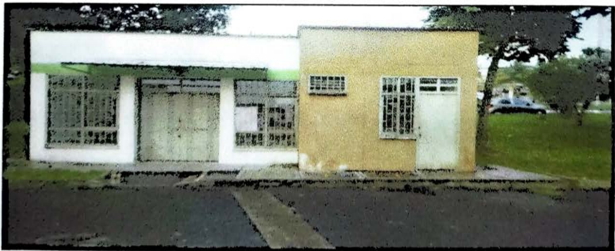
CASETA NUEVA ARMENIA ETAPA 2 55 MT