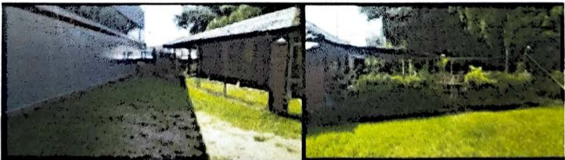
LA ALAMBRA 15 MTS CERRAMIENTO GIMNACIO AL AIRE LIBRE Y PARQUE INFANTIL