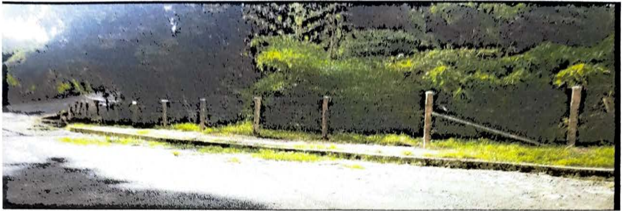
ARCO IRIS 53 MTS LADERA