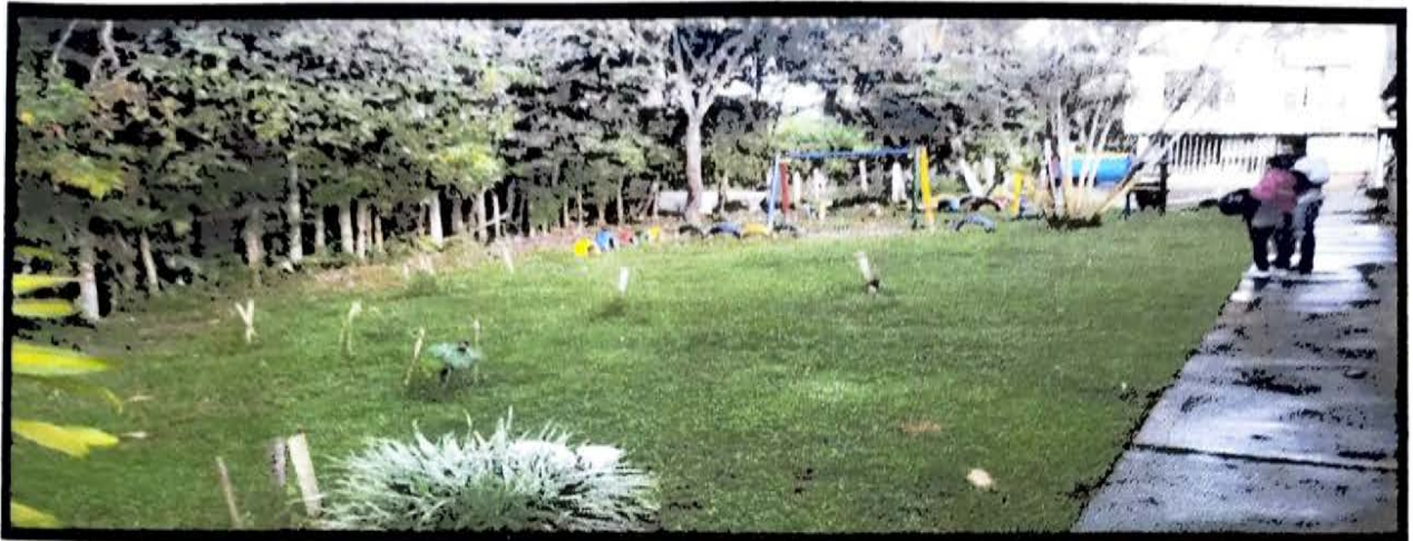
NUEVA ARMENA I ETAPA 50 MTS CERRAMIENTO PARQUE INFANTIL