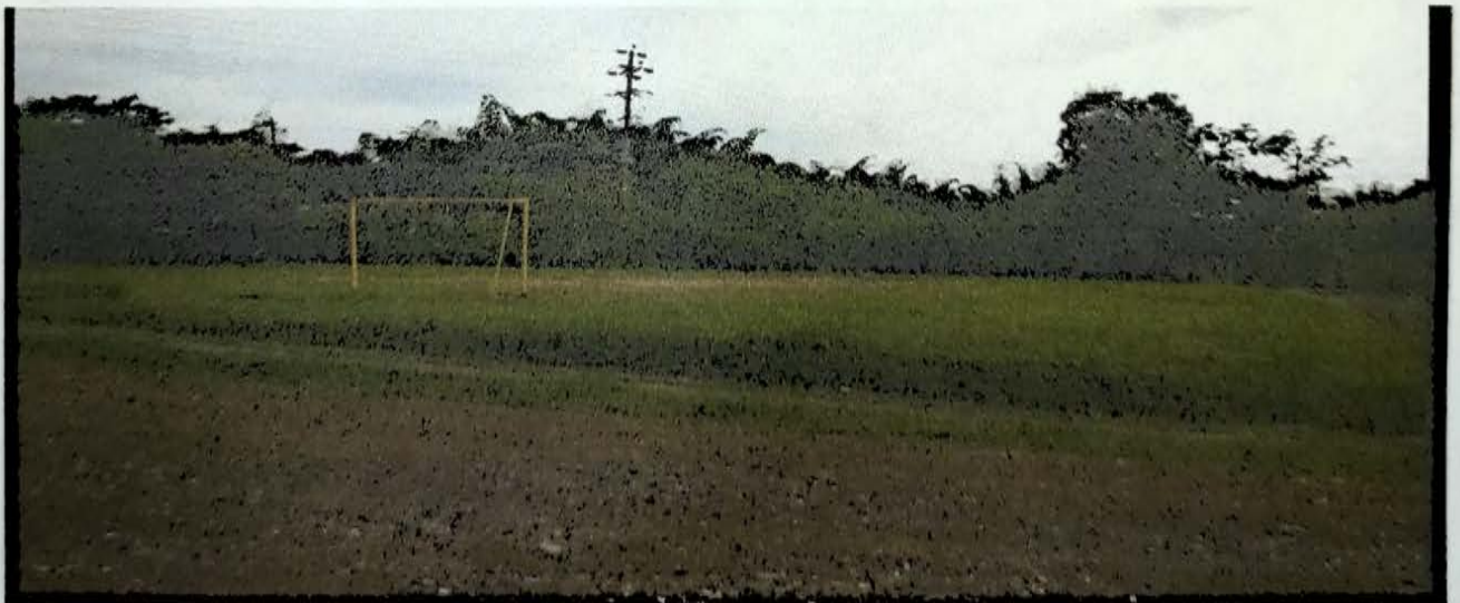
QUIINTA DE MARINA 100 MTS CERRAMIENTO CANCHA DE FUTBOLL