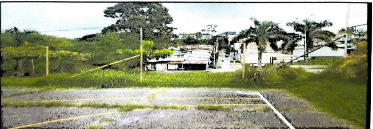
LOS KIOSCOS 20 MTS CANCHA DE