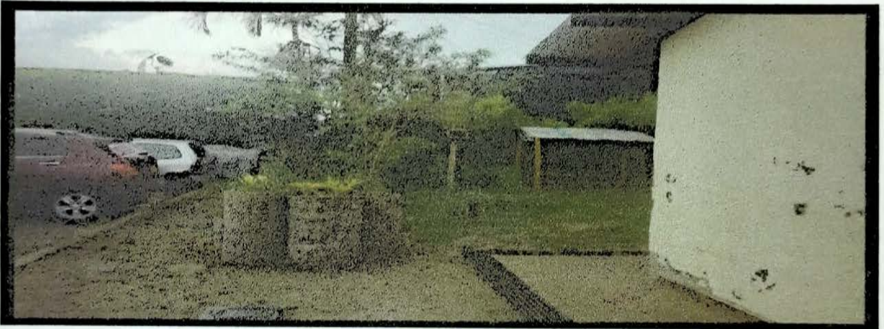
MONTECARLO 20 MTS CERRAMIENTO CASETA COMUNAL Y ZONAS COMUNES