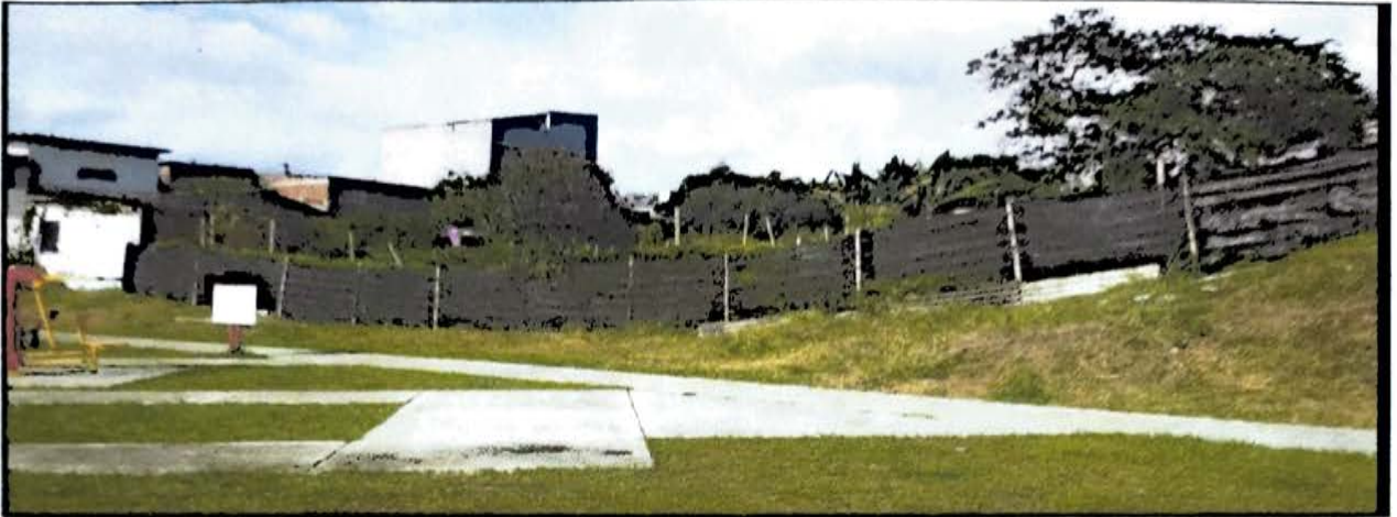
CANCHA DEL PLACER 25 MTS