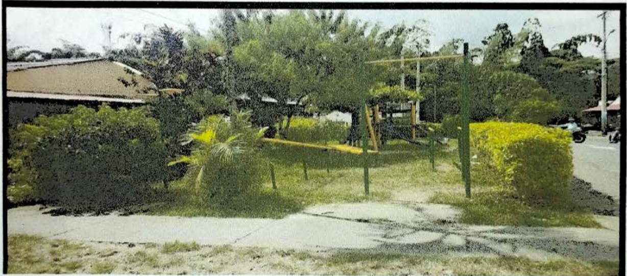
ARCADES 68 MTS CERRAMIENTO PARQUE INFANTIL