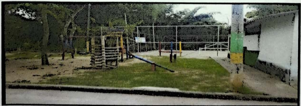
COOPERATIVO 30 MTS CERRAMIENTO PARQUE INFANTIL