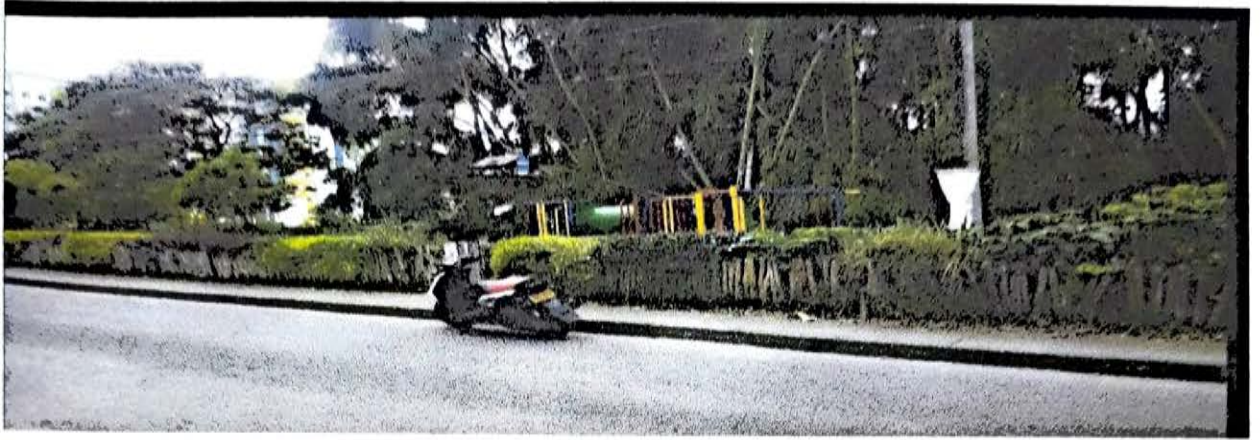
VILLA HERMOSA 57 MTS PARQUE INFANTIL