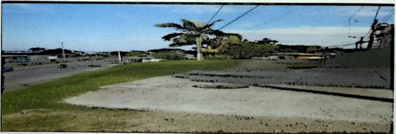
NUEVO ARMENIA ETPA III 40 MTS CERRAMIENTO REMANENTE