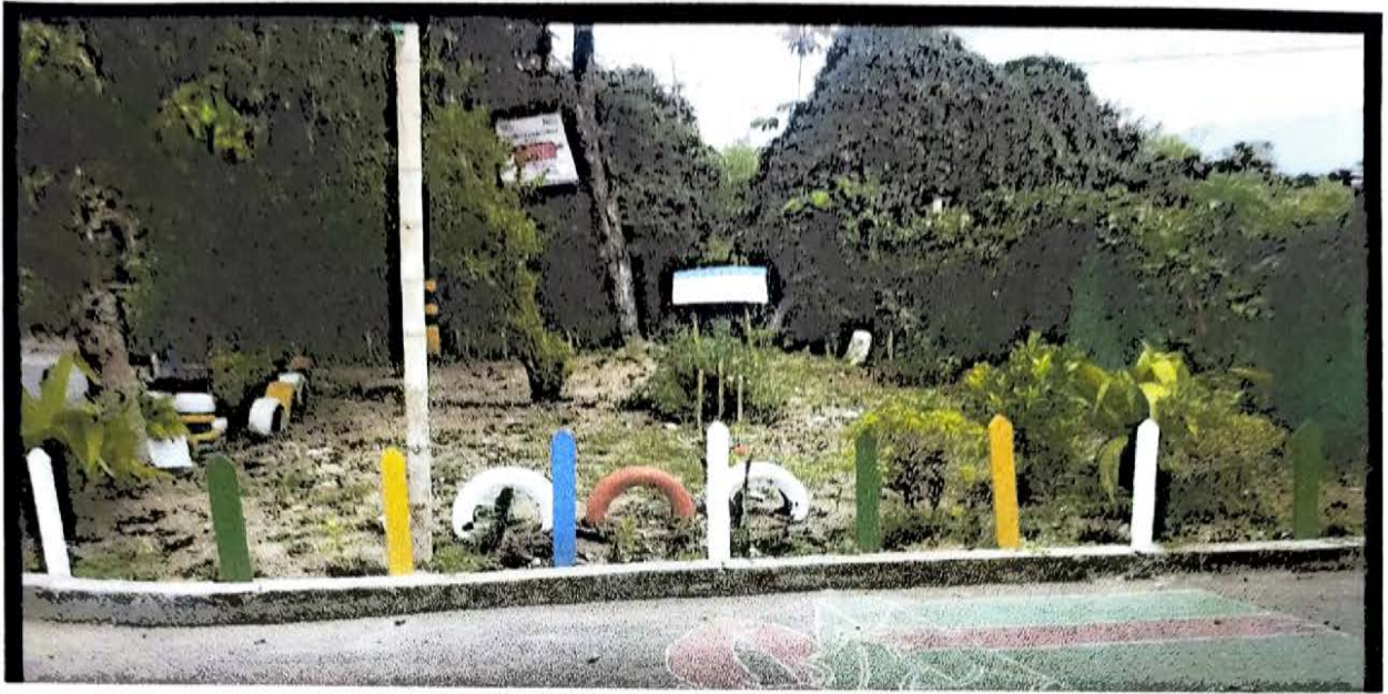
CECILIA 2 ETAPA 42 MTS CERRAMIENTO PARQUE INFANTIL