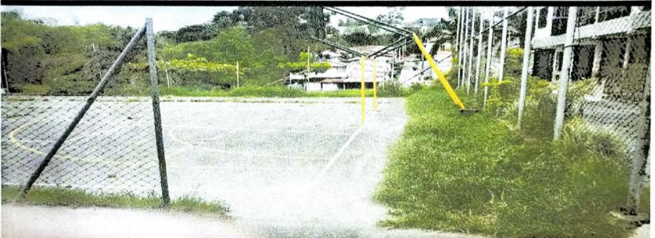
LOS KIOSCOS 3 MTS CERRAMIENTO CANCHA DE FUTBOLL