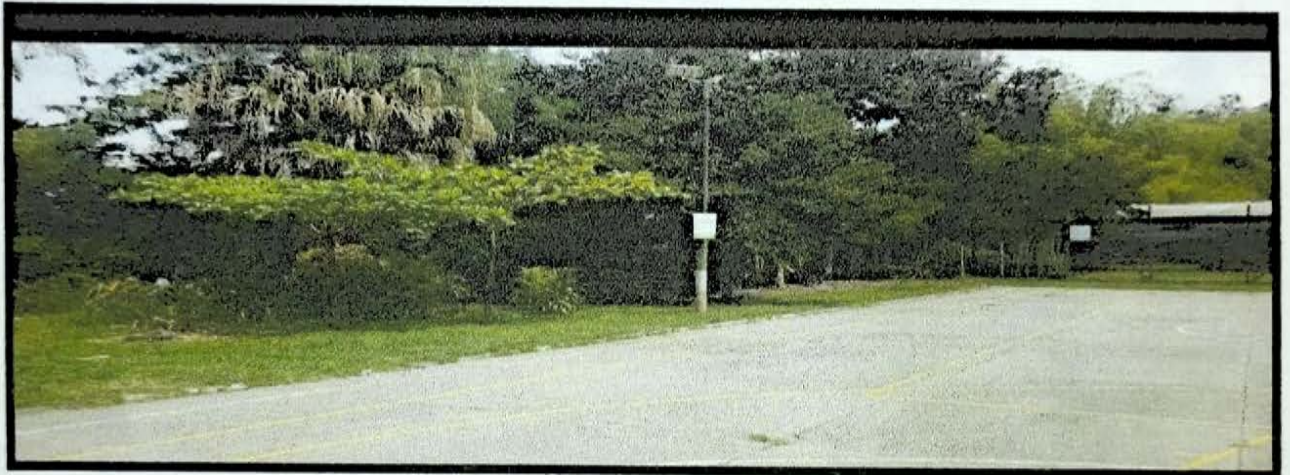
ESMERALDA41 MTS LINEALES ENCERRAMITNO COSTADO SALON COMUNAL LADERA