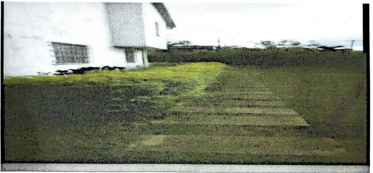
TERRAZA JARDIN 15 MTS CERRAMIENTO ZONAS VERDES