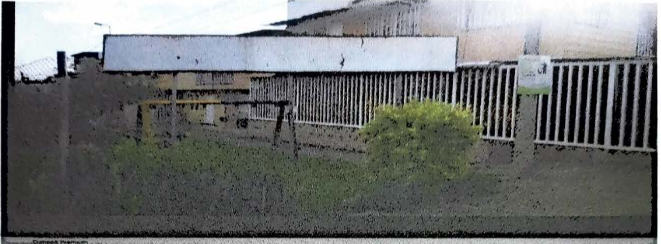
VILLA YOLANDA 8 MTS LINEALE CERRAMIENTO PARQUE INFANTIL