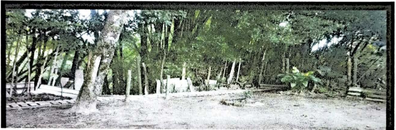
ARCO IRIS 22 MTS PARTE TRASERA CASETA COMUNAL