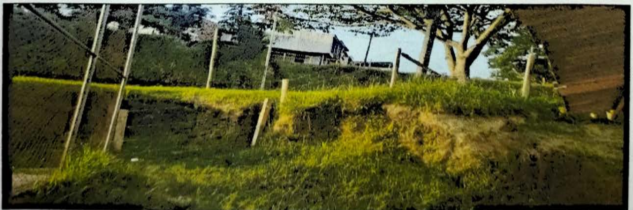
CRISTALINA 6 MTS EN TOTAL CON ALTURA ENCERRAMIENTO CASETA