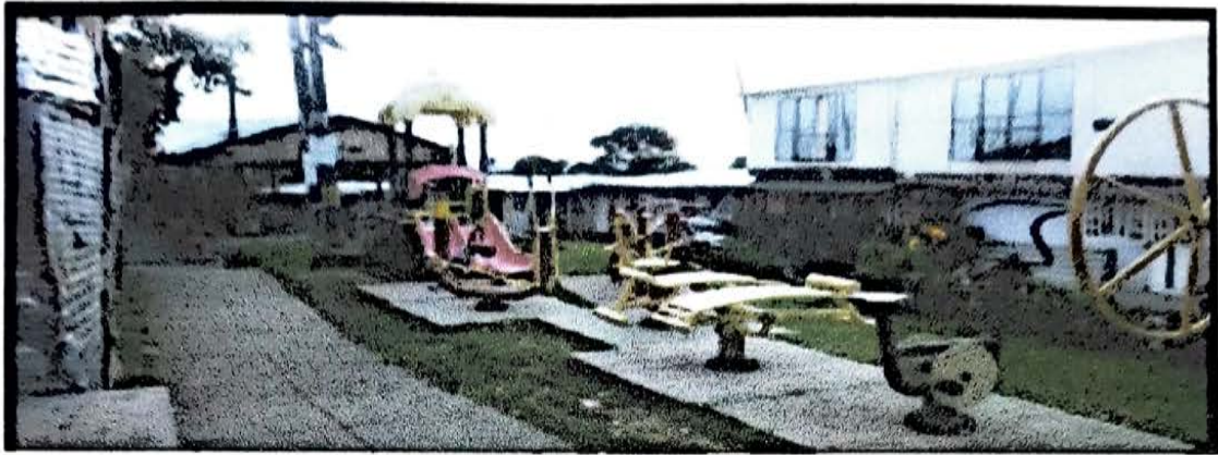
COLINAS 60 MTS CERRAMIENTO PARQUE GIMNACIO AL AIRE LIBRE