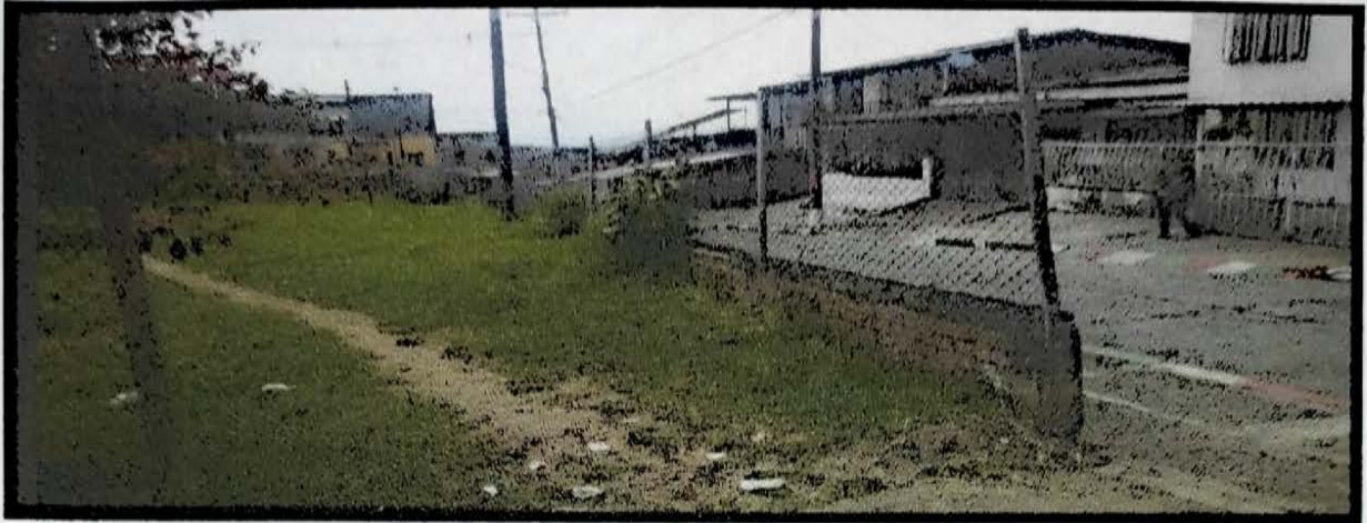
LA MIRANDA 3 MTS PUERTA PARQUE INFANTIL