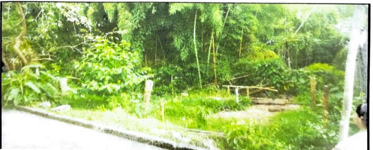
CIUDADELA EL SOL 30 MT RECUPERACION LOTE PARQUE INFANTIL