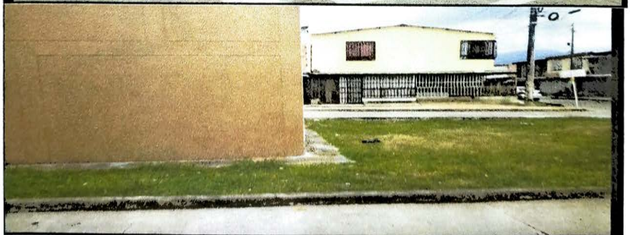
CECILIA1 ETAPA 68 MTS CERRAMIENTO CASETA COMUNAL