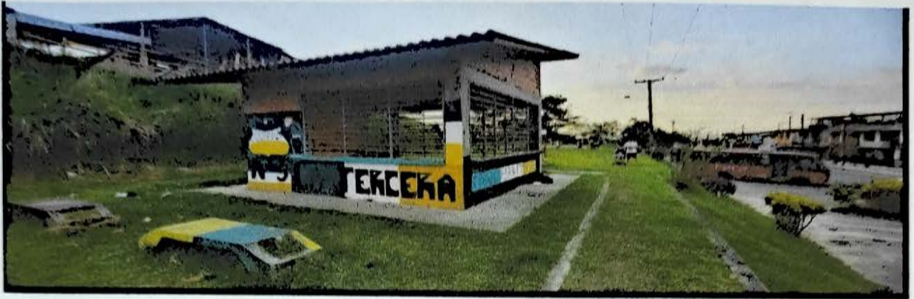
CECILIA 3 ETAPA 40 MTS KIOSCO PARQUE INFANTIRL