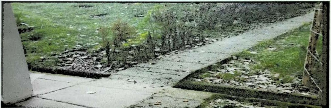
CRISTALINA 11 MTS CERRAMIENTO CASETA COMUNAL