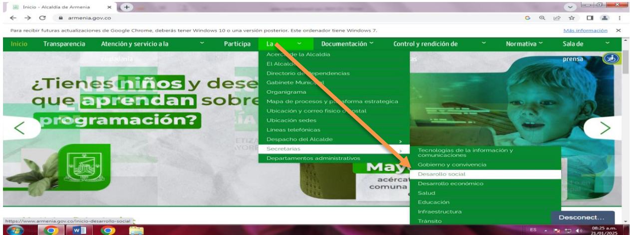
Ilustración 2 Canal de Atención - https://www.armenia.gov.co/politicas-planes-y-programas/participacion-ciudadana