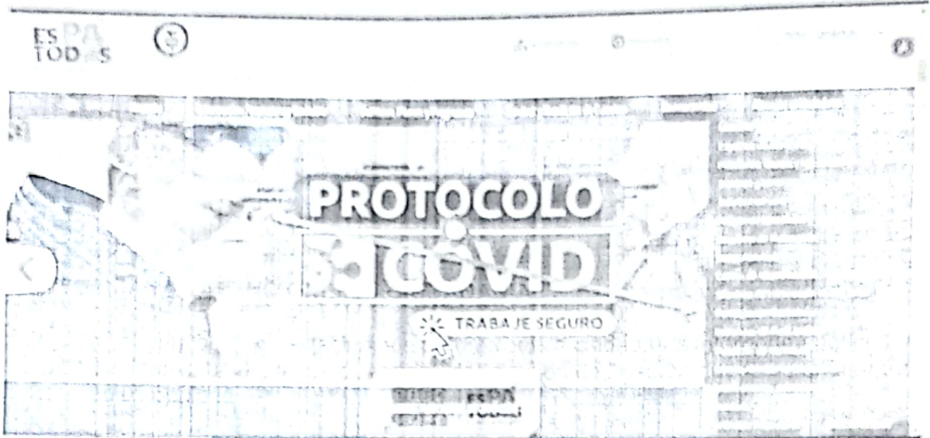
Ilustración 23 canal de Atención - https://www.armenia.gov.ge/politicos-planes-y-programas/participacion-ciudadana

Este canal cuenta con una estación que permite que la ciudadanía interponga peticiones quejas y reclamos, un espacio de servicios de atención en línea en donde se encuentran las siguientes opciones: