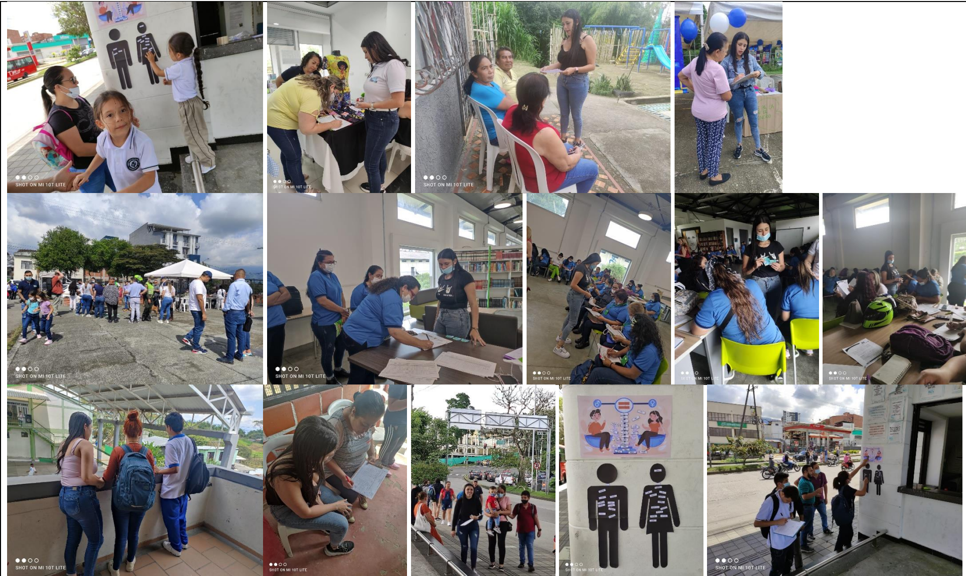
Se han realizado dos Capacitaciones favorables para empoderar y fortalecer 38 emprendimientos