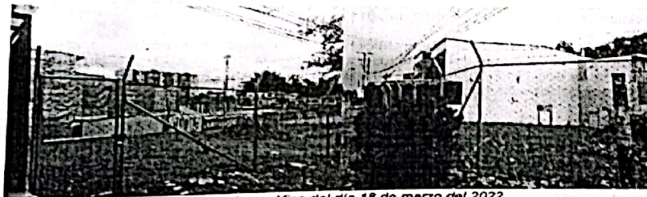
Registro fotográfico del día 18 de marzo del 2022

En atención a la solicitud recibida en la Subsecretaria de Catastro Armenia, radicada bajo los números de la referencia, donde solicita incorporación del bien inmueble localizado en el BARRIO LAS AMERICAS CALLE 23 No. 31 - 67, me permito informar que revisada la documentación aportada y de acuerdo el informe de visita a terreno realizada el día 18 de marzo del 2022, no se encontró construcción alguna sobre el lote objeto de requerimiento.