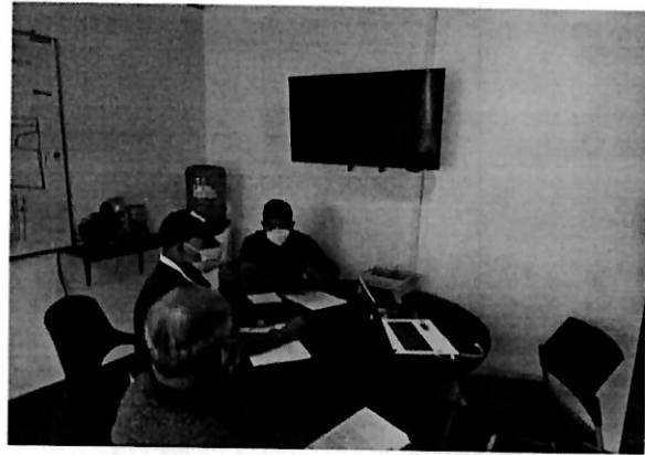
Comité Técnico, modificaciones acciones Plan de Acción 2021.