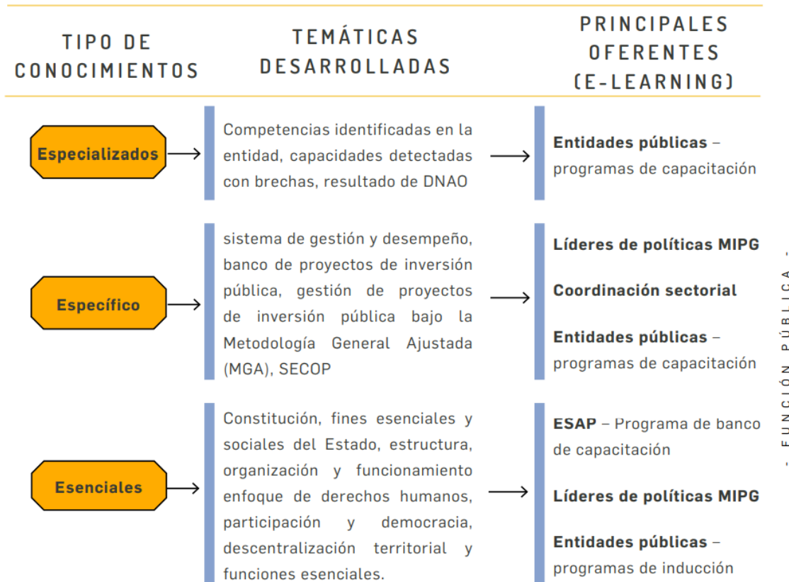
Figura 11. Organización de la oferta institucional de capacitación